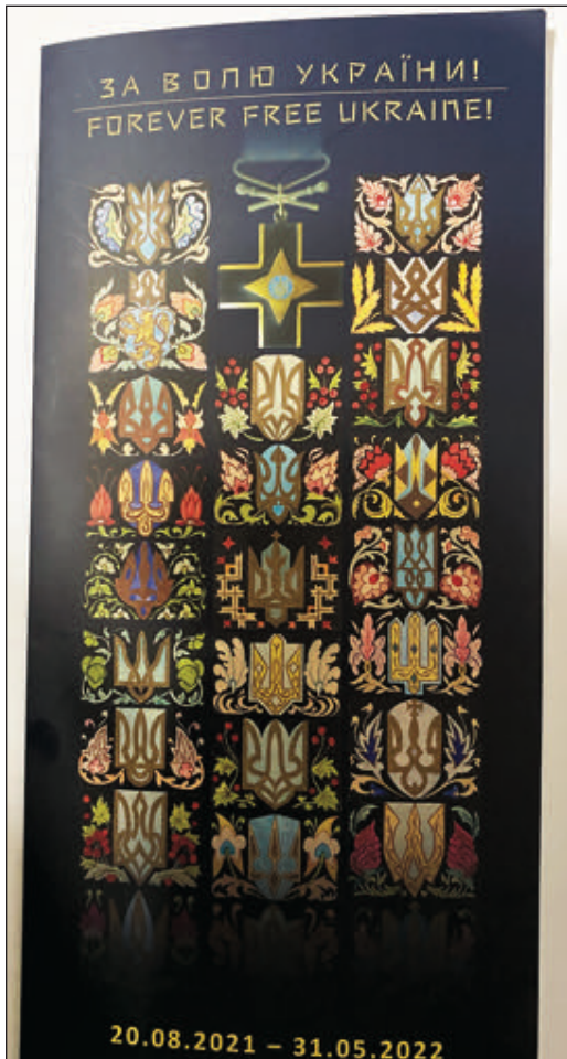
Брошура про виставку