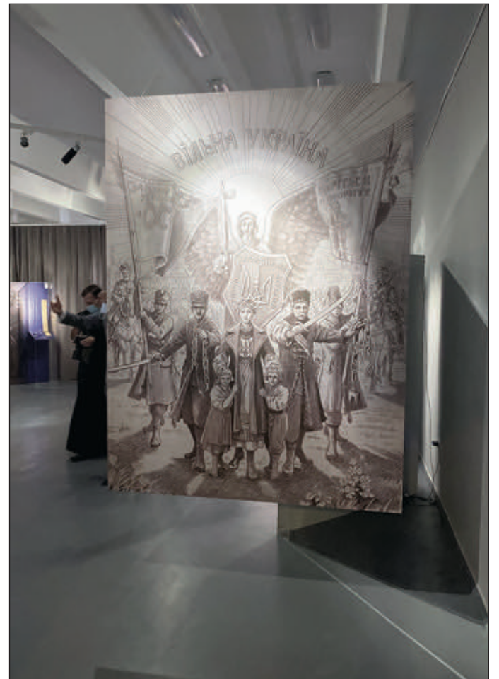
Зразок експонату з виставки

Нещодавно ми були свідками величного і пам'ятного відзначення 30-річчя Незалежності України, що відбулося в Україні та в українських громадах по цілому світі. А підготовка до такого знаменного святкування почалась ще багато місяців заздалегідь.