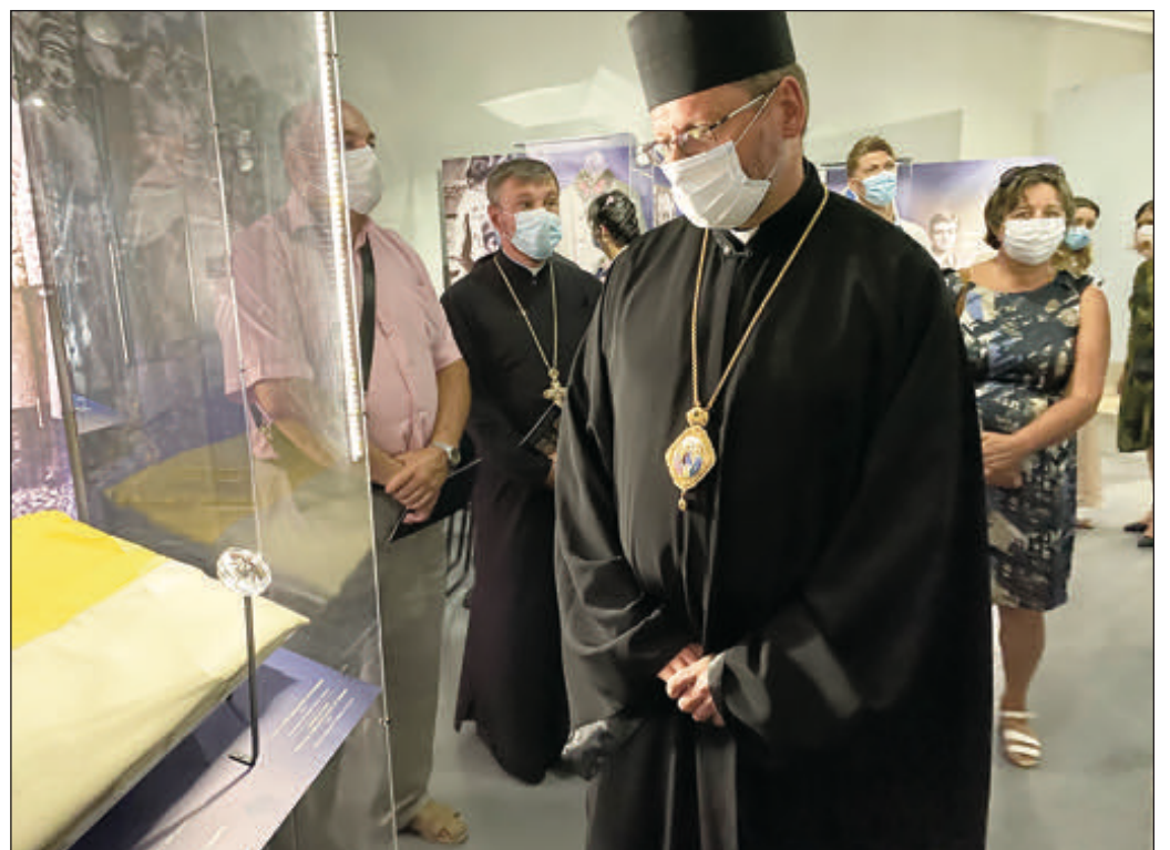
Блаженніший Святослав на виставці