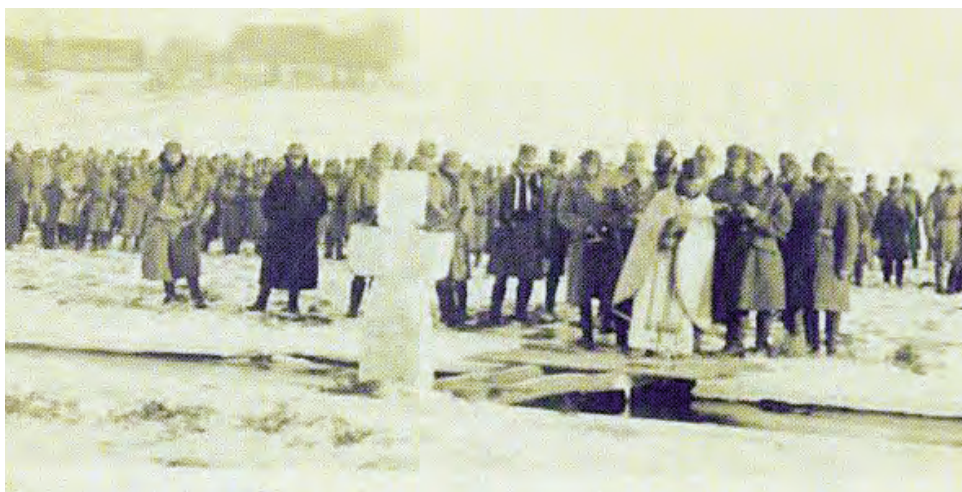
Водосвяття - Хатки-Соколів 1915