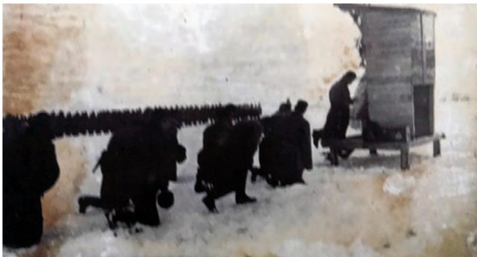
Полева Служба Божя