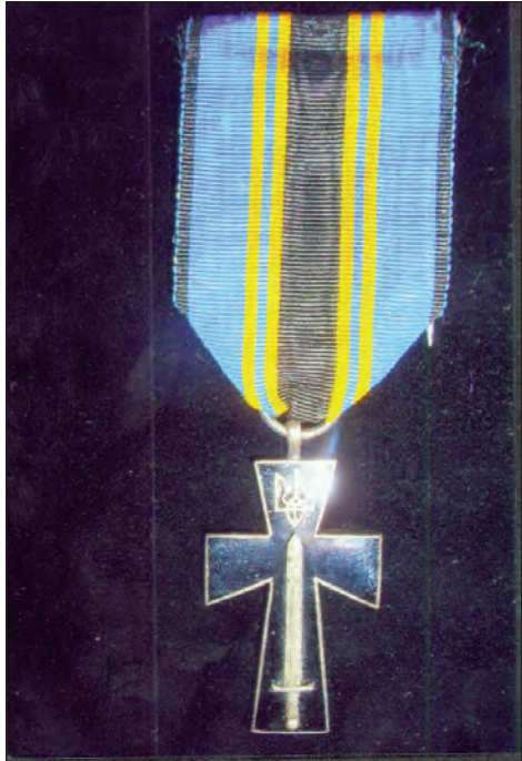
Орден (Хрест) Симона Петлюри