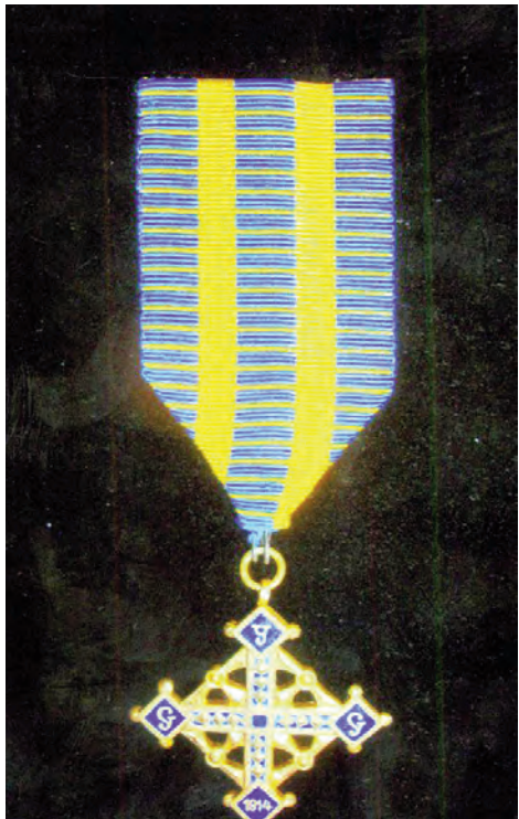
Хрест Леґіону Українських Січових Стрільців (Гуцульський)

Звичай виявлення признання окремих осіб чи угруповань за їхні героїчні подвиги, віддану працю, видатні досягнення і нагородження їх медалями, відзнаками був відомим впродовж століть. Ця форма виявлення, як також використання емблем, інсигній, клейнод, гербів вельможних родів, державних печаток, були вжитку в Україні у різні історичні епохи. З часом використання та виготовлення різноманітних зразків та категорій медалей стали дуже популярними. Наприклад – інсигнії організацій та товариств як відзнаки приналежності, пам'яткові медалі окремим особам чи з нагоди особливих подій, сувенірні зразки медалей з нагоди промислових та народних виставок, відзнаки спортивних товариств, значки політичних партій тощо.