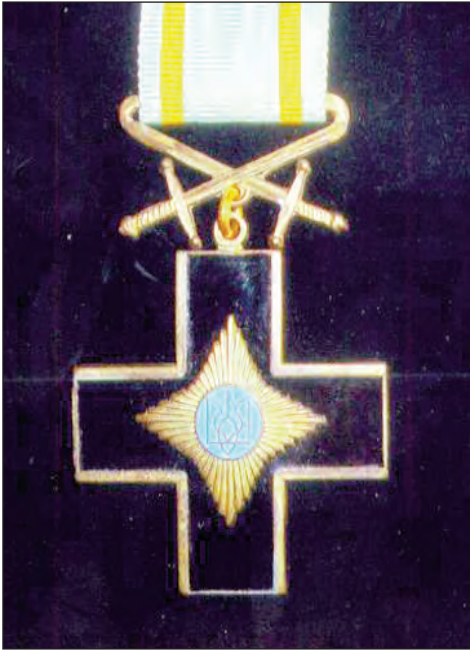
Орден (Лицарів) Залізного Хреста Армії Української Народної Республіки