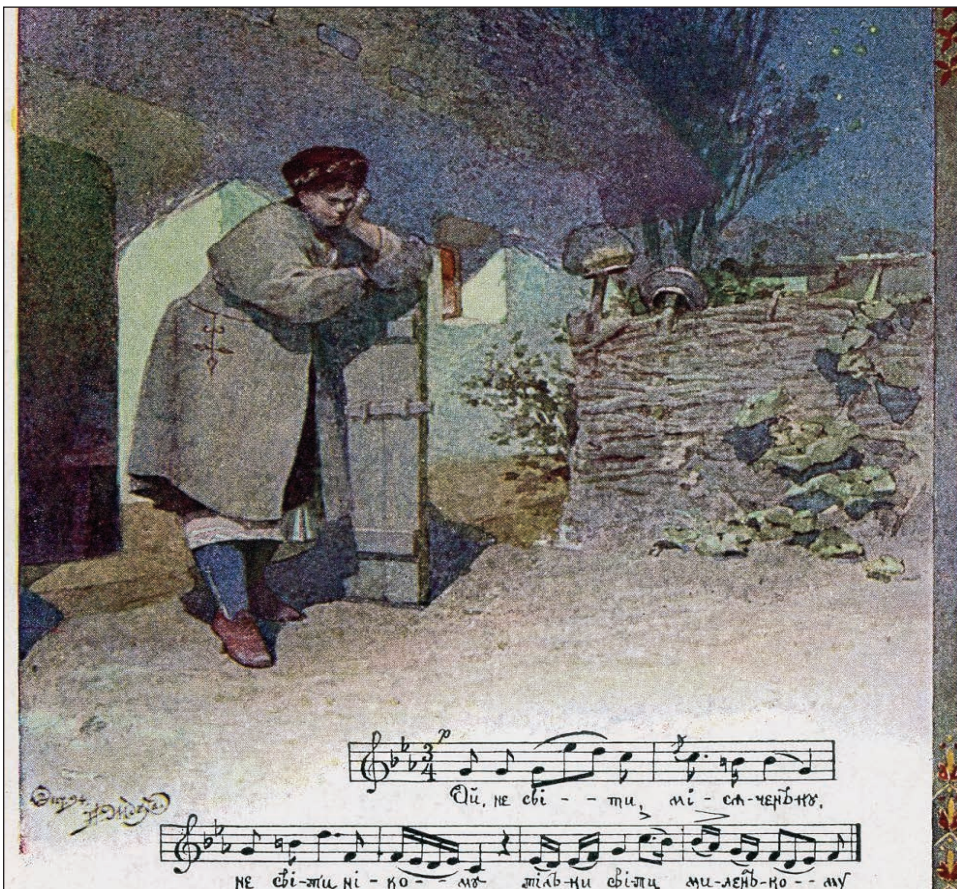
На світлинах: зразки поштових карток із колекції музею у Стемфордї, КТ

Широке використання пошти-вок, як одного із засобів комунікації з родиною, друзями та передачі різних коротких повідомлень почалося у кінці 19-го століття. Практичність та популярність поштівок пришвидшили їх розвиток і дуже скоро скромна прямокутна карточка розвинулася в поштівку з усе кращими та більш витонченими ілюстраціями, зображаючи велику кількість предметів та тем. Згодом розвинувся ще один напрямок - до ілюстрацій на поштівках додали пісні (ноти і слова), а це надало поштівкам ще більшого емоційного вислову. Ось такі листівки з відповідним зображенням та словами пісні виражали та передавали більше і краще почуття, яке хотів висловити відправник, але не мав на це достатньо власних слів. Коли зростав попит на все більш вибагливі зображення на поштівках, видатні мистці почали творити ілюстрації для них, сприймаючи це за честь та престиж.